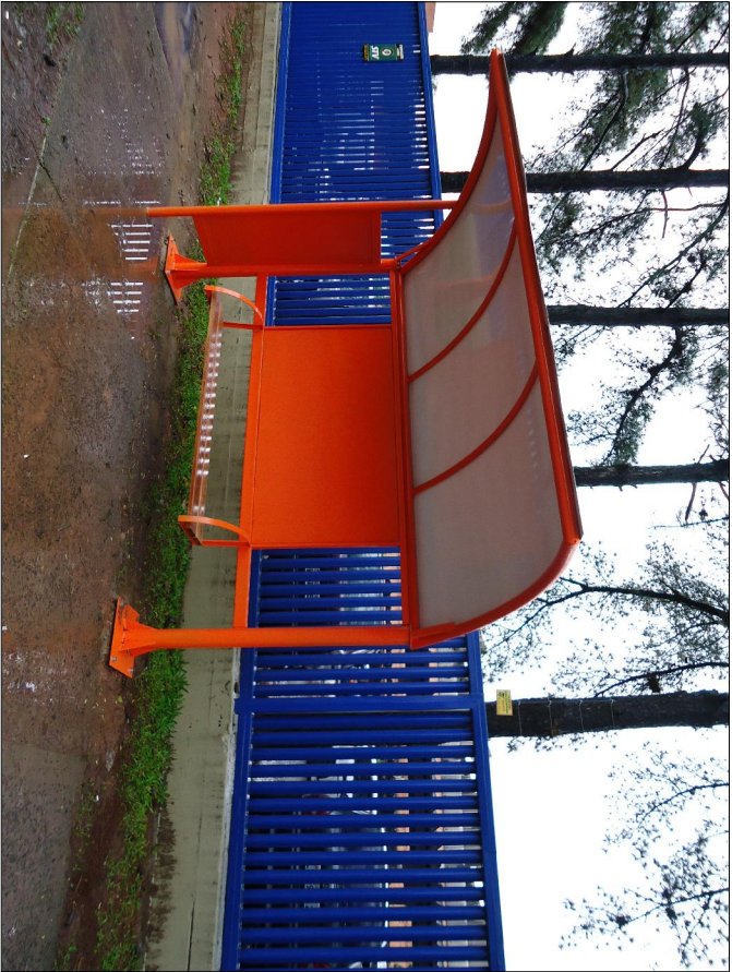
02 | Abriço de passageiros - Imagem do Equipamento Instalado DESENVOLVIDO POR: UNIDADE DE GERENCIAMENTO DE PROJETOS