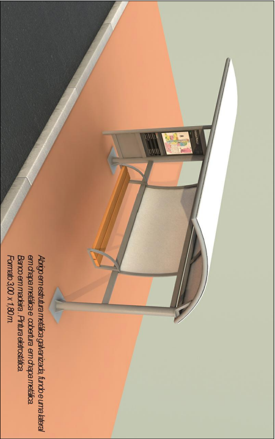
01 | Abriço de passageiros - Perspectiva DESENVOLVIDO POR: UNIDADE DE GERENCIAMENTO DE PROJETOS